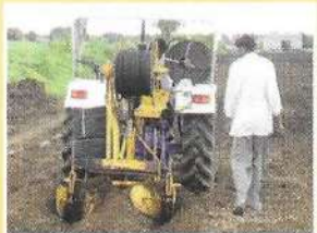
पाईप गाडण्याचे मशीन

* (अॅप्रोटेक पोरस पाईप पध्दती आमच्या मार्गदर्शनप्रमाणे चालविली तर)