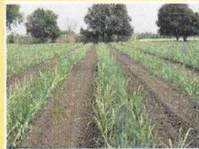
उसाची बहारदार शेती