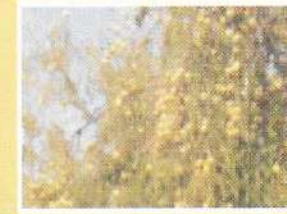
मधुर फळांची डौलरदार झाडे