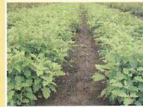
शानदार भाजीपाल्याचा मळा